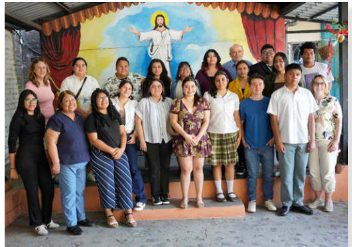
San Salvador: CILCA-Reisegruppe und Stipendiaten im Hof des Kirchenamtes mit Bischofin Guadalupe Cortez (1. Reihe, 2.v.l.)

Wir treffen 18 Stipendiaten im Bischofsbüro, die über ihre Ausbildung von der Secundaria bis zur Lizentiatur berichten. Es wird ein informatives Gespräch über die Schwierigkeiten der Ausbildung mit ihren finanziellen Nöten (cuotas, Fahrgeld, Schul-Material etc.), aber auch mit den Chancen in den Semesterpausen