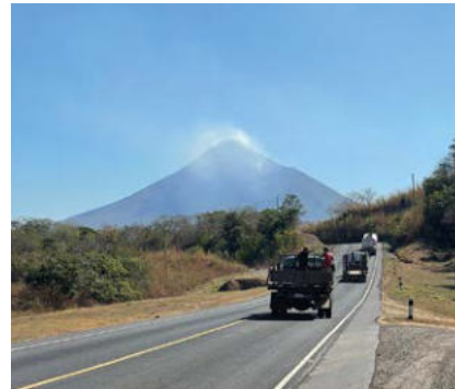
Vulkan am „pazifischen Feuerring“

Heute steht das kulturelle Erbe Nicaraguas im Vordergrund. Es wurde im „Haus der drei Welten“ von Ernesto Cardenal und Dietmar Schönherr in Granada vergegenwärtigt, ist aber aktuell durch Gesetz aufgelöst. Dennoch atmet Granada in seinen kolonialen Straßen und Gebäuden, in barocken Kirchen und modernen Geschäften den Geist einer wechselvollen Geschichte. Am Ufer des Nicaragua-Sees steht das Standbild des Gründers Francisco Hernandez de Córdoba (1524). Ferner schaukeln die Boote, mit denen man zu den Islettas im See vor Granada schippern kann, die zum Teil mächtigen und reichen Leuten gehören, zum Teil aber auch der Tierwelt überlassen