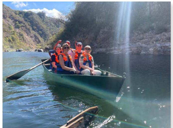
Die Reisegruppe im Canyon von Somoto

Eine Attraktion ist der Canyon von Somoto. Der Rio Coco hat hier eine alte Felsformation durchstoßen. Auf einer Bootstour