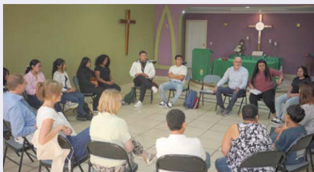
Treffen mit den Stipendiaten in Tegucigalpa

2. Auch nach dem Abschluss bestehen Schwierigkeiten, eine Anstellung zu finden. In allen Ländern herrscht Arbeitslosigkeit – oft braucht man Beziehungen, oft geht es über Praktika. Die jungen Leute knüpfen schon während des Studiums Kontakte.