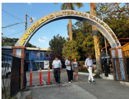
Eingang zur „Universidad Luterana Salvadoreña“

Unser Gespräch thematisiert die Situation in El Salvador. Viele kritische Geister wie Rechtsanwälte, Journalisten, Naturschützer haben das Land verlassen. Eine Gemeindereform reduzierte die Zahl der Gemeinden drastisch mit großem Verlust