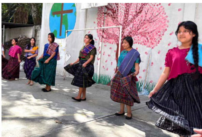
Tanz der MILAGRO-Mädchen