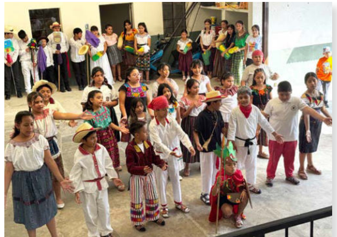
Historisches Spiel in der Schule der ILAG

Die Schule und die MILAGRO-Mädchen lernen wir zuerst in