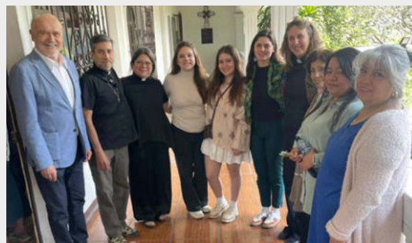
Nach dem Gottesdienst: Gruppenbild mit Kirchenpräsidentin Karen Castillo (im Talar)