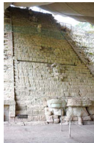
Die Inschriften der Tempeltreppe in Copán erzählen die Geschichte dieses Ortes in allen Einzelheiten.

Unser erstes touristisches Highlight steht an: wir fahren auf holpriger Straße nach Copán, um am nächsten Tag – nach einer kalten Nacht – die Maja-Ruinen zu besichtigen: Beeindruckende Bauten, insgesamt sieben Städte übereinander – wenn eine neue Stadt gebaut wurde, wurde die alte einfach zugeschüttet. Es gibt auch einen Ballspielplatz – der Gewinner hatte die Ehre, den Göttern geopfert zu werden!