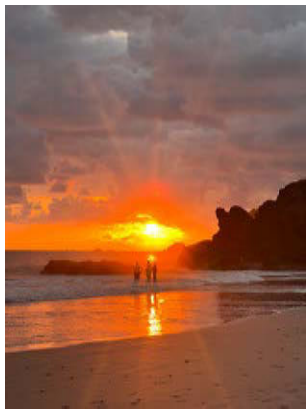
Sonnenuntergang am Pazifik

Früh am Morgen gehts zum Nationalpark Manuel Antonio. Wir wollen Tiere sehen, bevor die Menschen sie vertreiben.