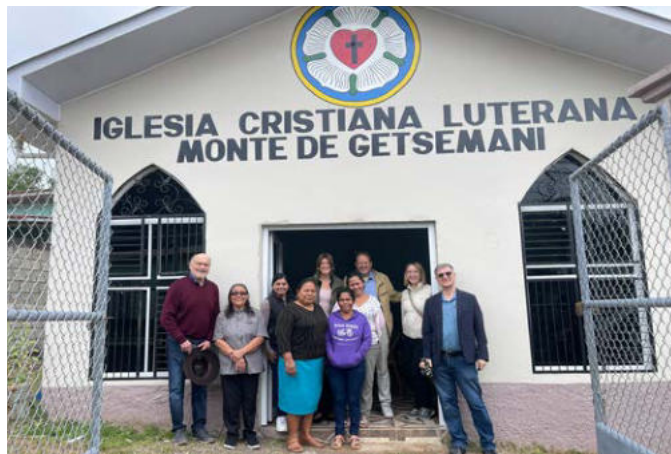
Vor der Gemeinde „Monte de Getsemani“

Am nächsten Morgen besuchen wir diese Gemeinde. In